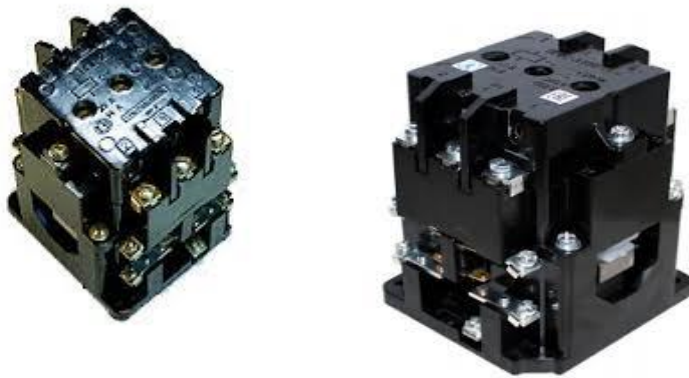
Пускатель магнитный CJX2 6510 100 А

Пускатели электромагнитные серии CJX2 предназначены для применения в стационарных установках для дистанционного пуска непосредственным подключением к сети, остановки и реверсирования трехфазных асинхронных электродвигателей с короткозамкнутым ротором при напряжении до 660 В переменного тока частоты 50 и 60 Гц.