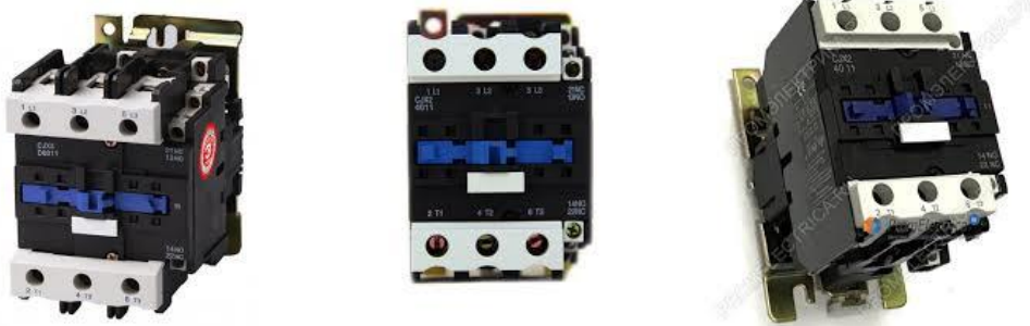
Пускатель магнитный PME-3102 UXЛ4

Пускатели электромагнитные серии PME-3102 предназначены для применения в стационарных установках для дистанционного пуска непосредственным подключением к сети, остановки и реверсирования трехфазных асинхронных электродвигателей с короткозамкнутым ротором при напряжении до 660 В переменного тока частоты 50 и 60 Гц.